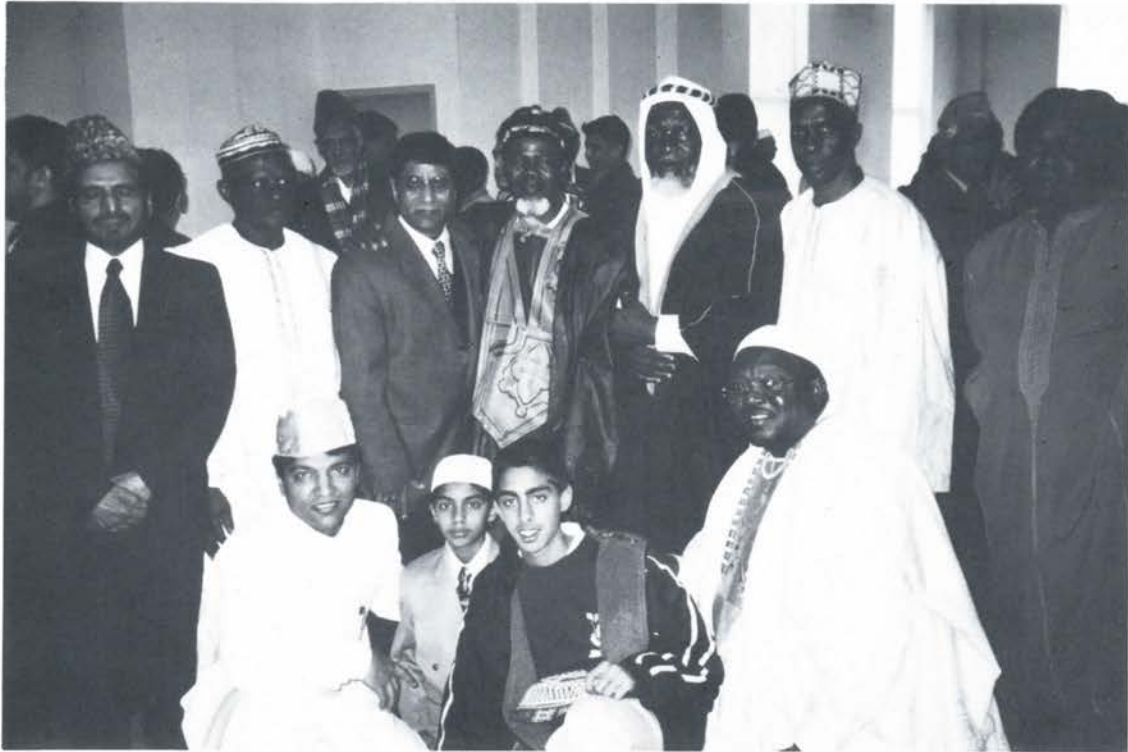
Some of those who attended the Eidul Adhia celebrations at the Baitur Rahman Mosque, Silver Spring, MD.