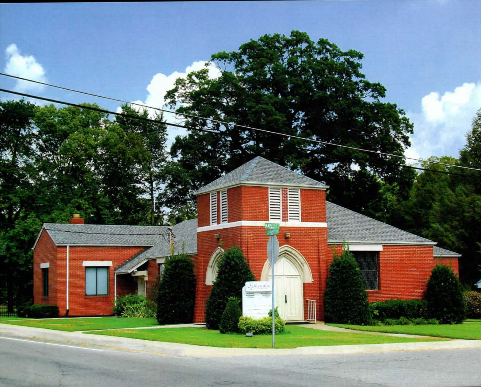
Masjid Mahmood, Smyrna, Tennessee