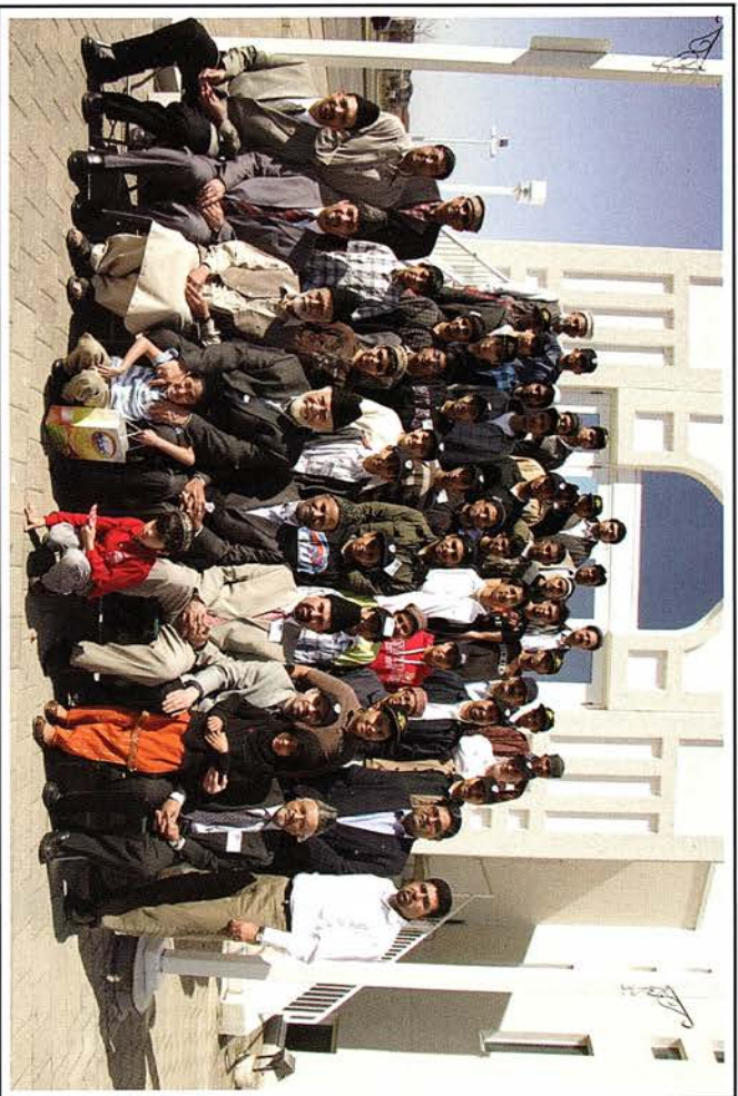
Maqfeen-e-Nau on Jamia Canada visit