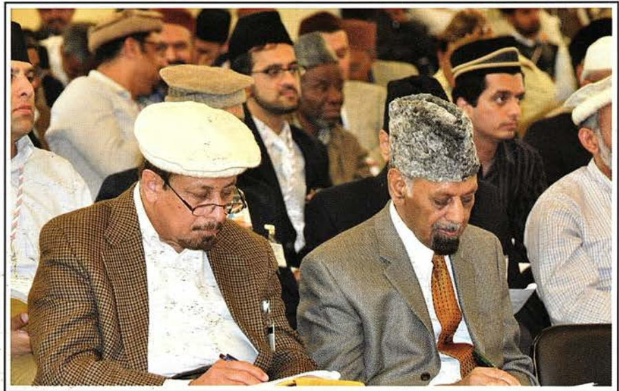
Scenes from 2010 National Majlis-e-Shura USA