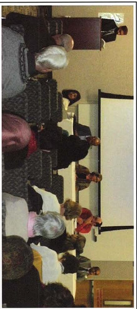
Interfaith event held by AMC, St. Paul MN

Charity - Helping Those in Need 2010 has seen many earthquakes, floods and other natural disasters, leaving millions of our people around the world in need.