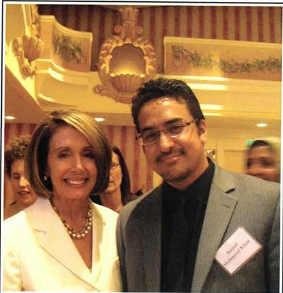
نیشنل پبلک ریلیشن سیکریٹری امجد محمود خان صاحب ہاؤس اسپیکر نیسنی پیلوسی کے ساتھ