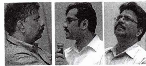
شام سخن میں شریک شعراء اور منتظمین