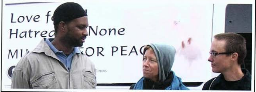
زاین الینوائے جماعت کی "مسلمز فور پیس" تبلیغی کی کاوش زاین جماعت اب تک ۳۰۰۰ سے زیادہ بروشر تقسیم کر چکی ہے